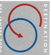
DESTINATION DES JAHRES 2000