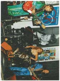
350 Gäste aus der Touristik- und Busbranche nanzen nach der Preisverleihung am 9. August 1999 bis in den frühen Morgen