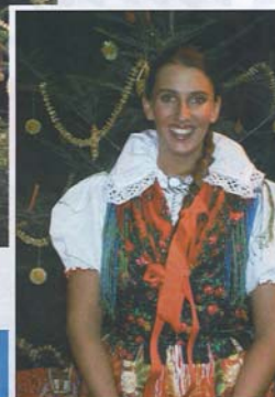
STRAHLEND WIE DER GESANG auch das Lächeln.