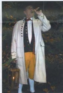
DER NACHTWÄCHTER bläst zum Aufbruch.

Lustig geht es natürlich auch in Böhmen im Wirtshaus zu. Mit einer Art Dudelsack und Oboe werden witzige Tanzlieder intoniert und der Tanzboden unsicher gemacht. Bis der Nachtwächter sei-