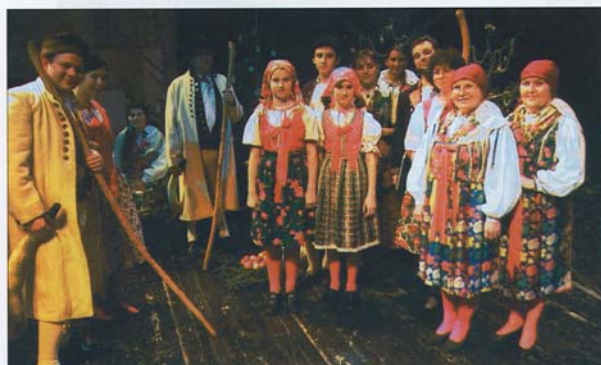
DAS ENSEMBLE setzt sich aus engagierten Laiendarstellern und Mitgliedern des Stadttheaters von Karlsbad zusammen - drei Generationen stehen dabei auf der Bühne.