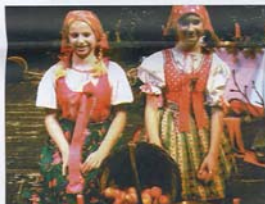
DIE JÜNGSTEN singen Lieder aus der Vorweihnachtszeit.

Sie genießen das winterliche Flair von Prag bzw. der aufwändig renovierten Kurstädte des Bäderdreiecks und erleben böhmische Weihnachtsbräuche, die von traditionsbewussten