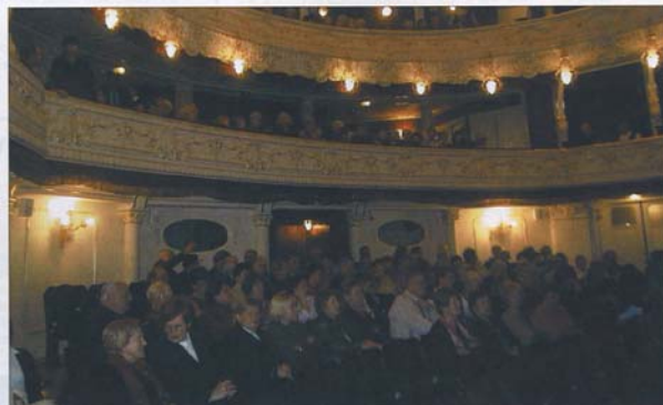
ERWARTUNGSVOLL sehen die Busgäste aus Deutschland im prachvoll restaurierten und heute nur für sie reservierten Stadttheater von Karlsbad dem Beginn der Vorstellung entgegen.