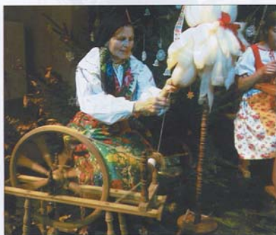
DIE ALTEN TRADITIONEN wie Wolle spinnen oder Klöppeln leben zur Vorweihnachtszeit wieder auf.

Über 1.000 Busgäste unternehmen alljährlich in der Vorweihnachtszeit einen Streifzug durch das Brauchtum Böhmens