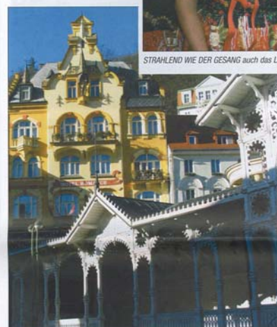
KARLSBAD - hier wird das Brauchtum Böhmens hochgehalten.