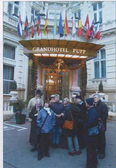
FÜRSTLICH VERWÖHNT - Busgäste vor dem neu renovierten Grandhotel Pupp.