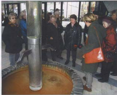
HEILENDES Thermalwasser sprudelt aus vielen Karlsbader Quellen.