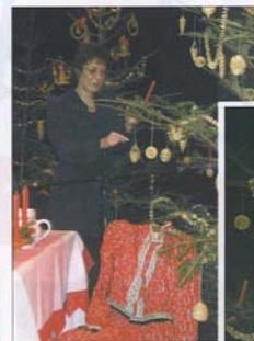
GESCHMÜCKT wird die weihnachtliche Bühne generell von den Wolff-Mitarbeiterinnen selbst.

ne Runden dreht und zum Aufbruch mahnt. Auch in Böhmen gibt es den Nikolaus, der am Vorabend des 6. Dezember allerdings nicht als Weihnachtsmann in Erscheinung tritt, sondern als historischer Bischof Nikolaus mit Mitra und im weißen Ornat daherkommt, begleitet von einem Engel und einem Teufel, der in einem